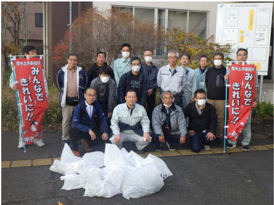
写真 4. 清掃活動終了後 集合写真