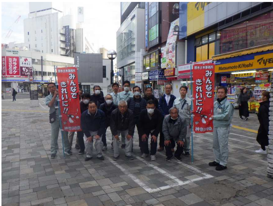
写真 1. 本厚木駅北口広場 清掃活動前 集合写真