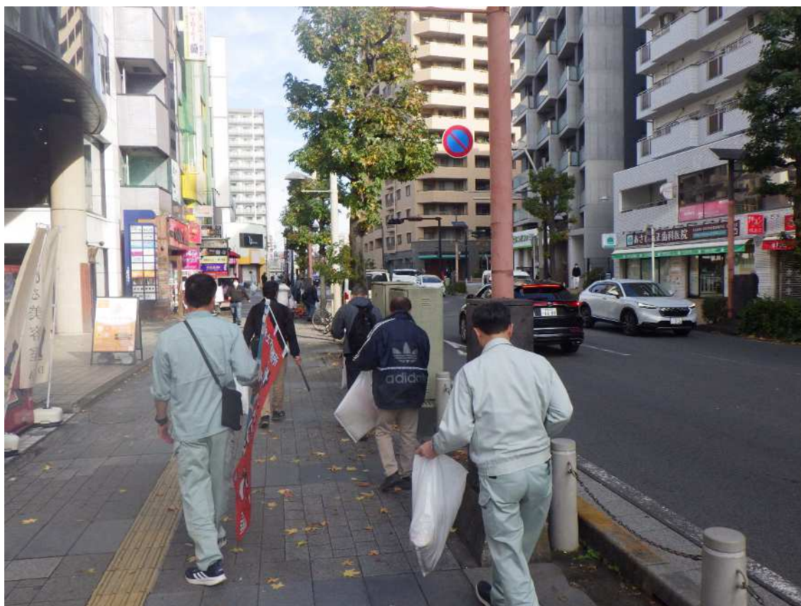
写真 2. 清掃活動実施状況①