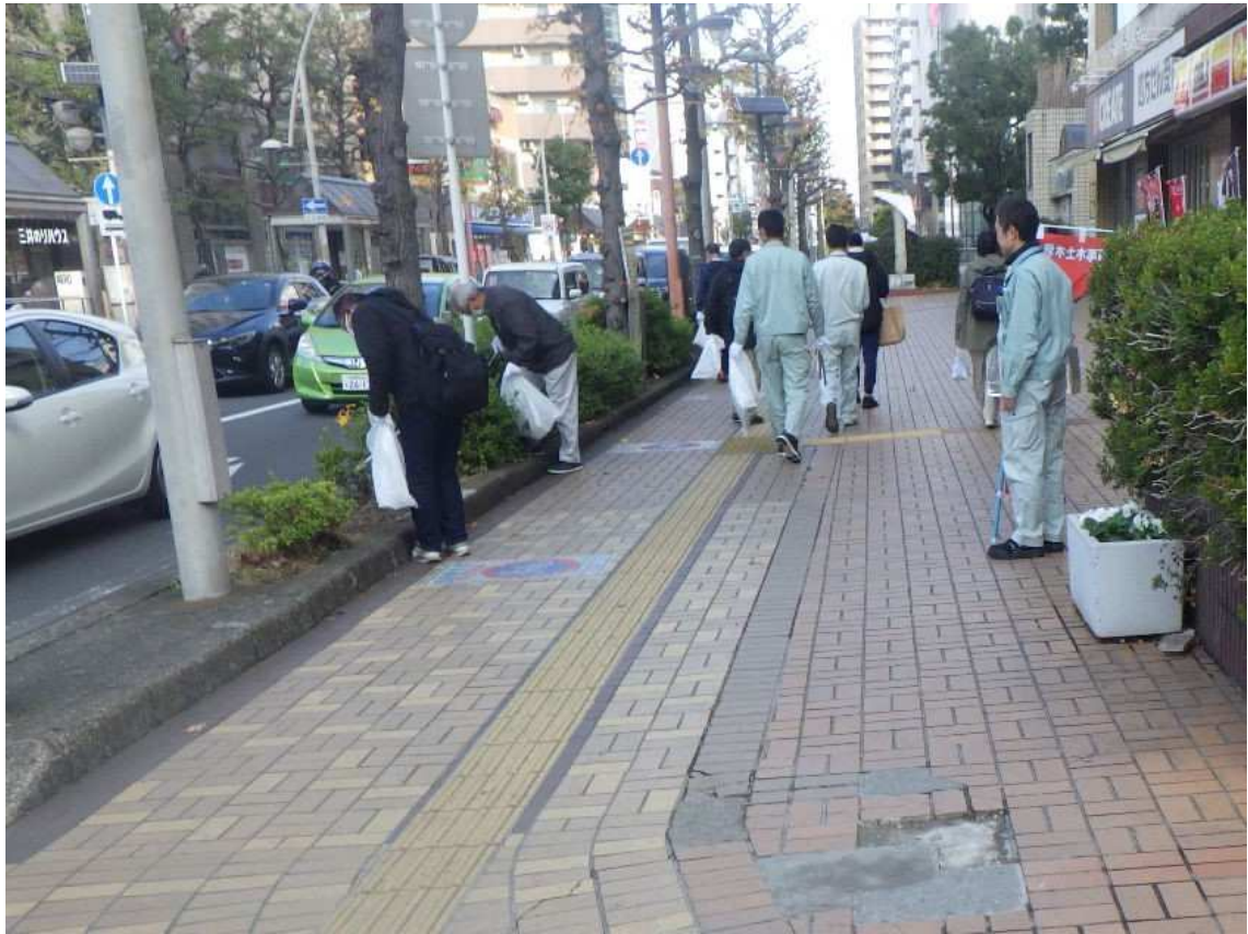
写真 3. 清掃活動実施状況②