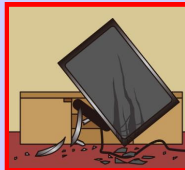
大事な家具や家電が台無しに！

地震発生時、建物が無事であっても、事前の備えがなければ、家具の転倒やガラスの飛散による被害を防ぐことはできません！お住まいに「危険箇所」がないか点検し、早めに 家具の転倒防止対策 、 ガラスの飛散防止対策 をしておきましょう。