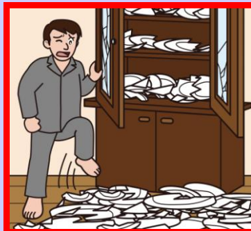
破損したガラス等でケガ！