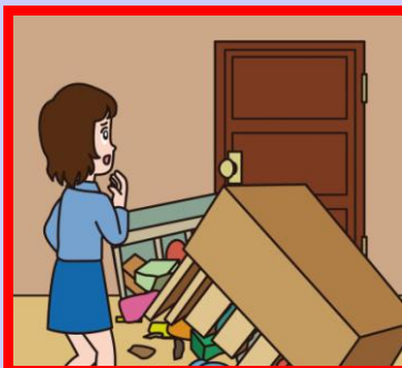
避難路がふさがれる！