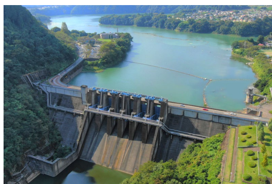
城山ダムと貯水池