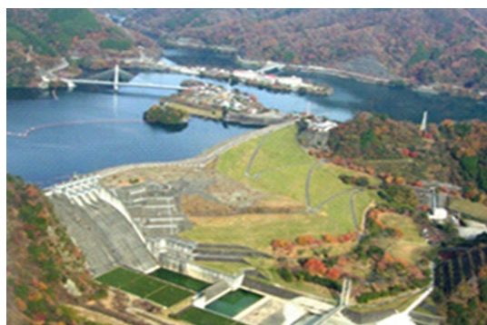
三保ダムと貯水池