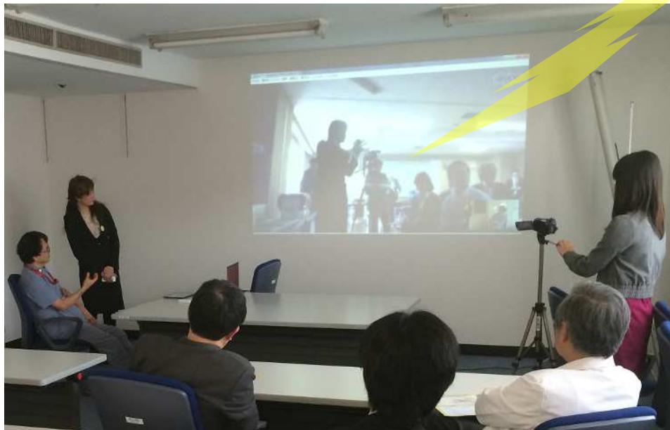
県立こども医療センター （横浜市）

2 施設間を通信で接続し、超音波診断による遠隔検診の可能性を検証している様子 (超音波に対して人体に似た特性をもつ素材を使用した訓練用モデルを使用)