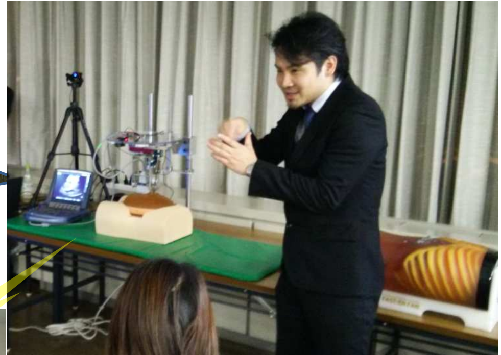
神奈川県産業技術センター（海老名市）