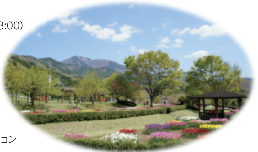
県立秦野戸川公園