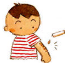
スクラッチテスト