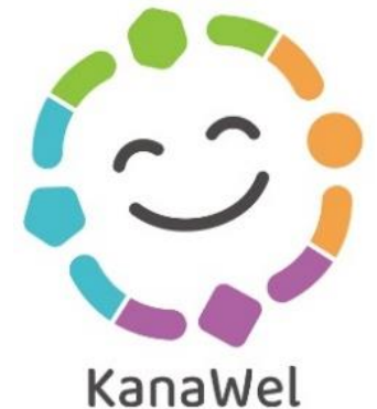
福祉機構ロゴマーク

「神奈川県当事者目線の障害福祉推進条例～ともに生きる社会を目指して～」の基本理念に基づき、障害者の地域生活を支援するとともに、科学的な福祉を研究及び実践し、そのために必要な人材を育成する拠点となり、福祉に関する諸課題の解決に広く貢献することにより、誰もがその人らしく暮らすことのできる地域共生社会を実現する。