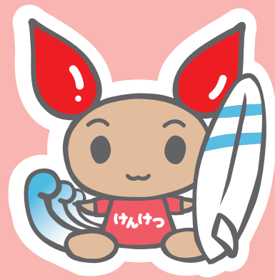
献血キャラクター