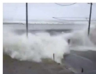
台風時における整備前の越波状況