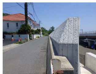
護岸嵩上げによる整備状況