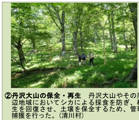
②丹沢大山の保全・再生 丹沢大山やその周辺地域においてシカによる採食を防ぎ、植生を回復させ、土壌を保全するため、管理捕獲を行った。（清川村）