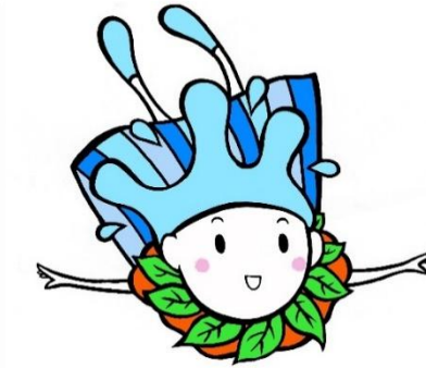
水源環境保全・再生 イメージキャラクター かながわ しずくちゃん

神奈川県では、水源環境保全税を財源として、水源地域の森林整備や生活排水対策などの事業（特別対策事業）を実施しています。