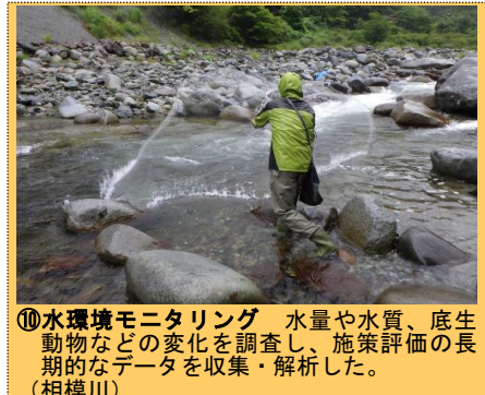
⑩水環境モニタリング 水量や水質、底生動物などの変化を調査し、施策評価の長期的なデータを収集・解析した。（相模川）