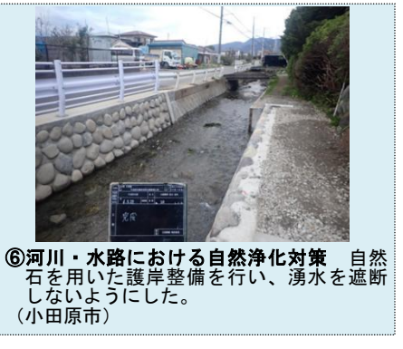
⑥河川・水路における自然浄化対策 自然石を用いた護岸整備を行い、湧水を遮断しないようにした。（小田原市）