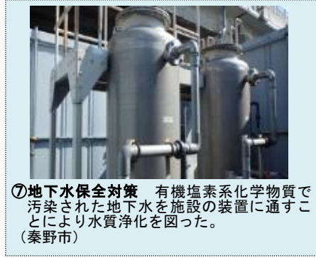
⑦地下水保全対策 有機塩素系化学物質で汚染された地下水を施設の装置に通すことにより水質浄化を図った。（秦野市）