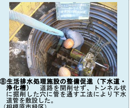
⑧生活排水処理施設の整備促進（下水道・浄化槽） 道路を開削せず、トンネル状に掘削した穴に管を通す工法により下水道管を敷設した。（相模原市緑区）