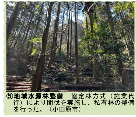
⑤地域水源林整備 協定林方式（施業代行）により間伐を実施し、私有林の整備を行った。（小田原市）