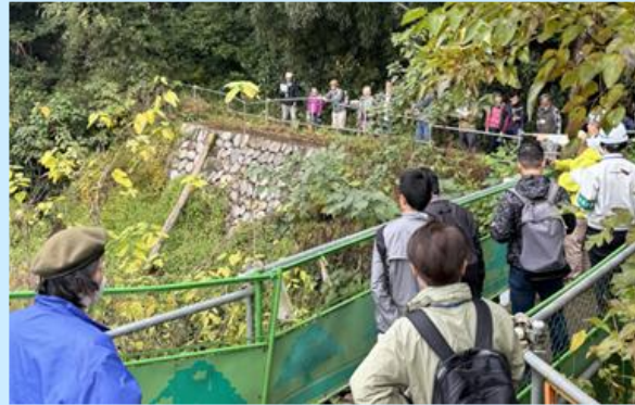
河川・水路における自然浄化対策の推進（相模原市） ＜現場視察＞