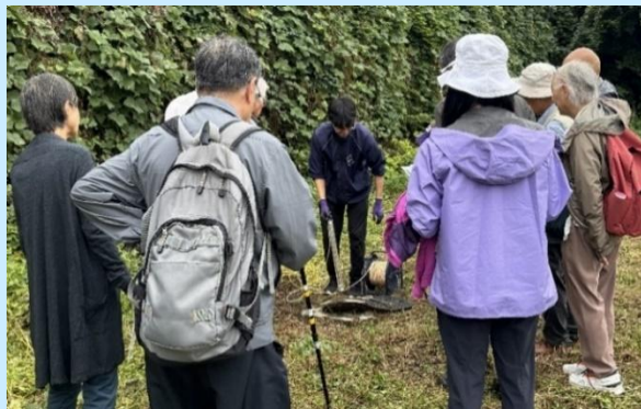
地下水保全対策の推進（秦野市） ＜地下水採水の実施地を視察＞