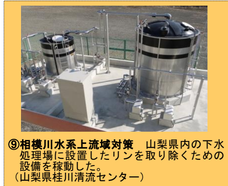
⑨相模川水系上流域対策 山梨県内の下水処理場に設置したリンを取り除くための設備を稼働した。（山梨県桂川清流センター）