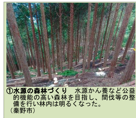
①水源の森林づくり 水源かん養など公益的機能の高い森林を目指し、間伐等の整備を行い林内は明るくなった。（秦野市）