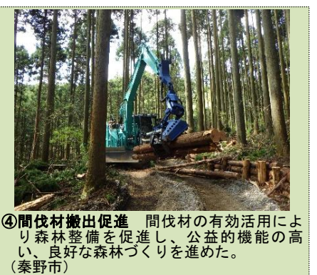
④間伐材搬出促進 間伐材の有効活用により森林整備を促進し、公益的機能の高い、良好な森林づくりを進めた。（秦野市）