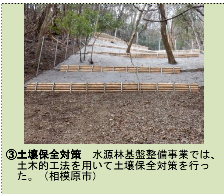
③土壌保全対策 水源林基盤整備事業では、土木的工法を用いて土壌保全対策を行った。（相模原市）