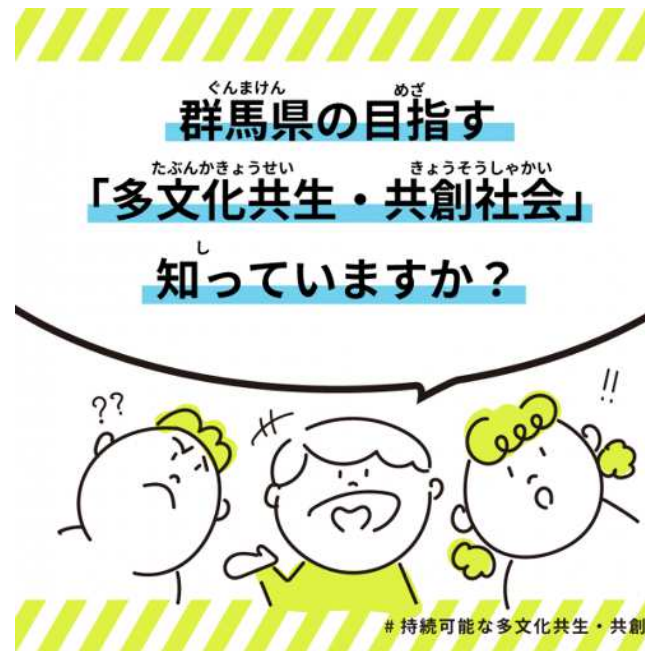
群馬県の啓発スライド画面