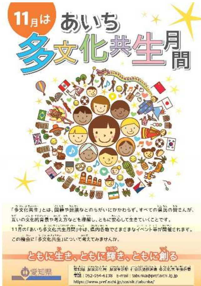
愛知県の啓発ポスター