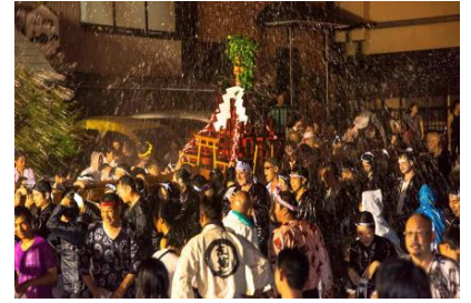
湯かけまつり(本番)の様子

[内容] 温泉街を練り歩く神輿にむかって温泉の湯を浴びせ、担ぎ手も観客も一緒になって盛り上がる「湯かけまつり」を5月23日(土)の本番に先がけ、万葉公園内で体験できる初のイベントです。