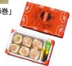
崎陽軒「昔ながらのシウマイ(6個入)」