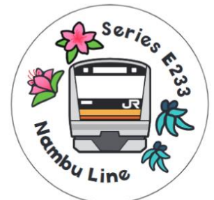
オリジナルシール

生田緑地(川崎市)、川崎市緑化センター(川崎市)、三溪園(横浜市)、山手イタリア山庭園(横浜市)、大船フラワーセンター(鎌倉市)、ヴェルニー公園(横須賀市)