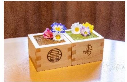
升ティラミス花盛り(抹茶/ほうじ茶)