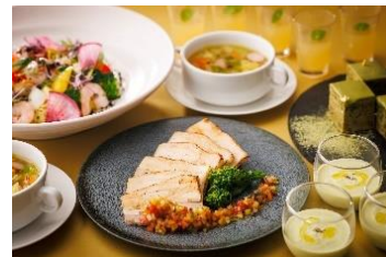
お料理の一例 (ホテルメトロポリタン 川崎)