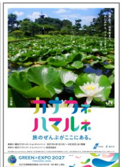
ポスター(左から、みなとみらい・箱根神社・三溪園)