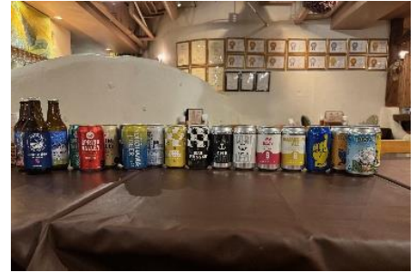
各ブルワリーのクラフトビール