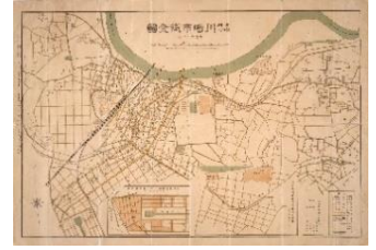
古地図(大正13年当時) 【川崎市市民ミュージアム蔵】