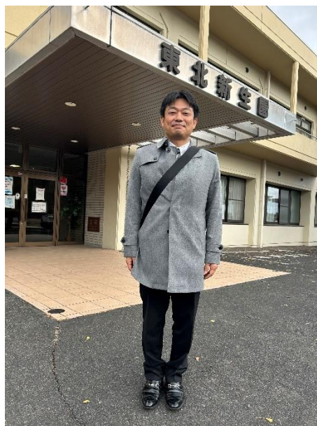
東北新生園の事務所前