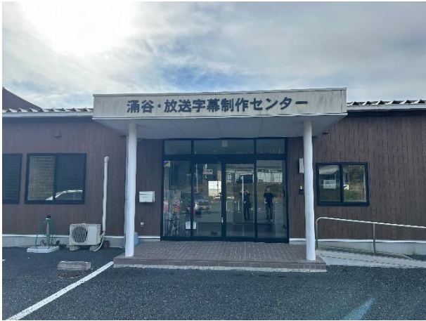
放送字幕製作センター