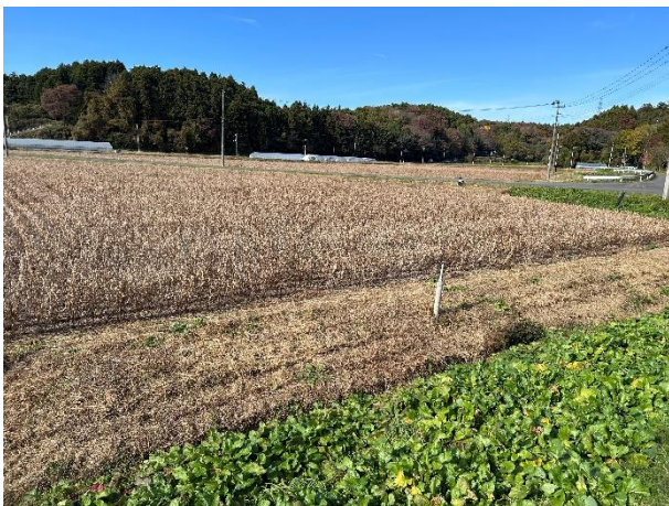
放送字幕製作センターの周りに広がる大豆畑 この畑の大豆を豆腐作りに使用している