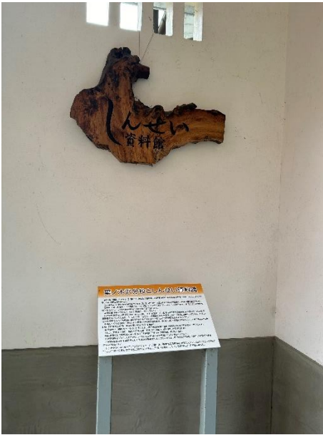
資料館「しんせい」の看板