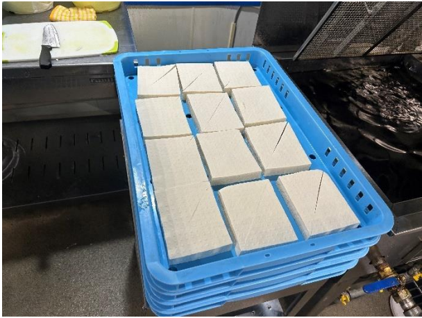
製造している豆腐