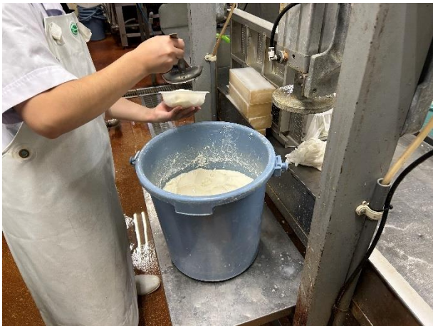
豆腐をすくっておぼろ豆腐をつくっているところ