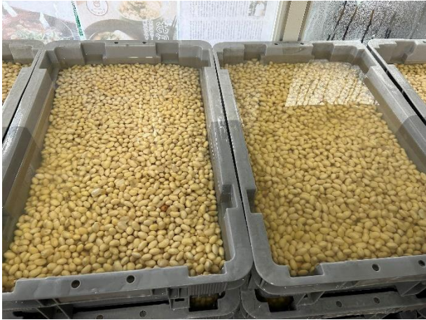
豆腐作りに使う大豆