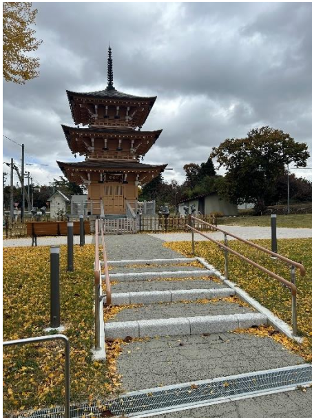
建立された慰霊塔