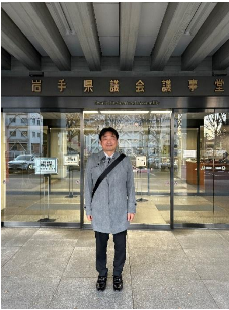
岩手県議会の入り口