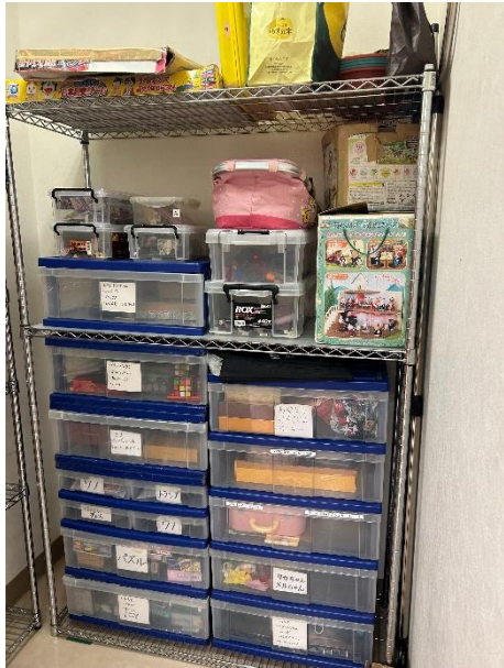
学童クラブのおもちゃ、遊具の収納