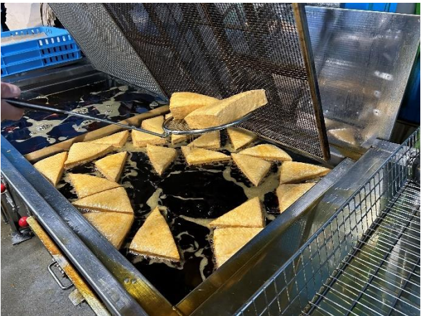
三角油揚げを揚げているところ