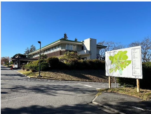
のぞみの園の案内看板と事務所