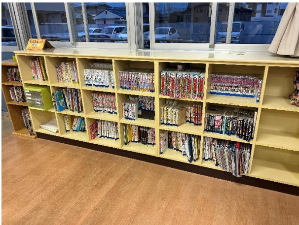
学童クラブの部屋の本棚