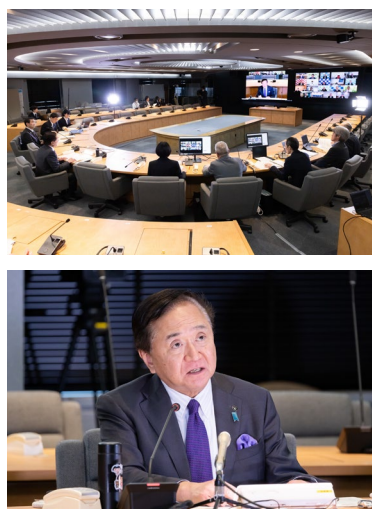
(写真)第1回県・市町村首長会議の様子