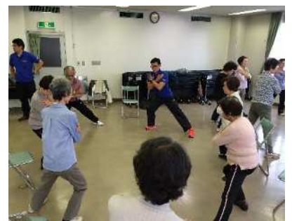
大磯町での「アンチロコモ教室」風景

「互助」とは、近隣の人々や地域住民が相互に支え合って、協力・協働して取り組むこと