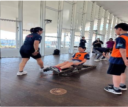
③ セーリング（ハンザ）体験（日本セーリング連盟）