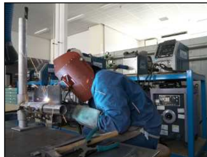
炭酸ガスアーク溶接実習