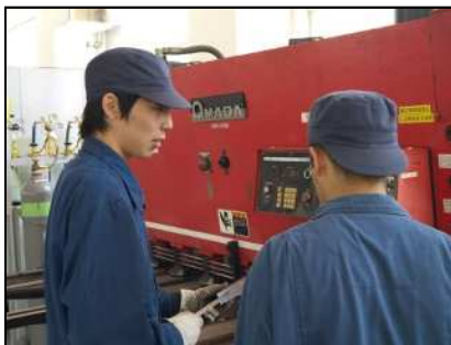
安全衛生(機械取り扱い)