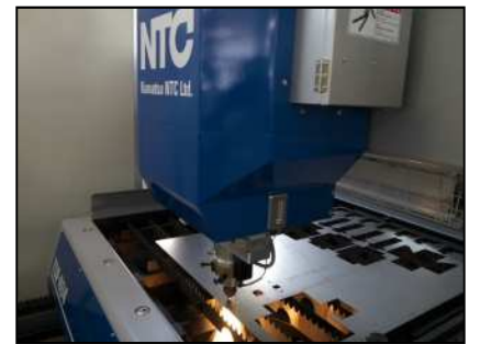
精密板金実習(レーザ加工)