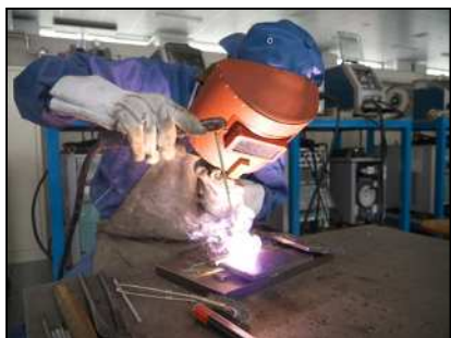
被覆アーク溶接実習