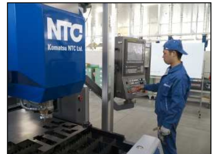
精密板金実習(レーザ加工)