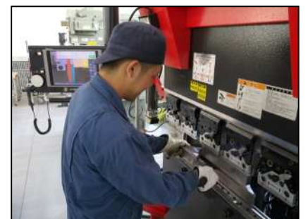
精密板金実習(プレスブレーキ)