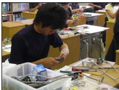
電気工事士試験対策