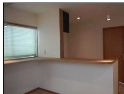
建築施工総合実習