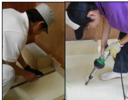
内装施工（床仕上げ）