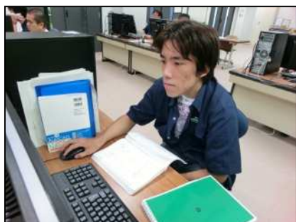
3次元C A D実習 (使用ソフト : Inventor)