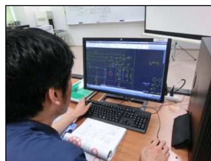
2次元C A D実習 (使用ソフト : AutoCAD)