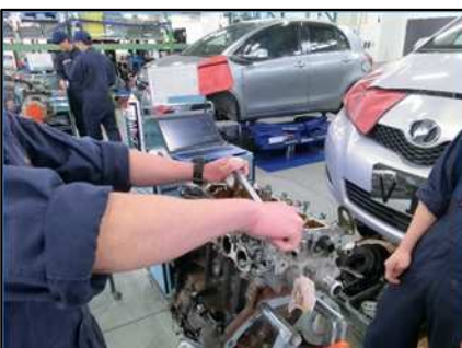
エンジンオーバーホール実習