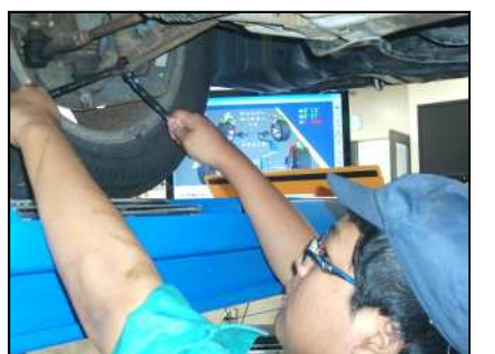
アライメント実習 (応用)