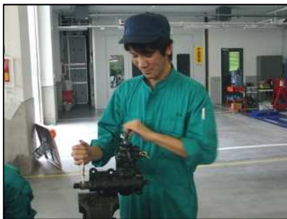
ステアリング装置実習