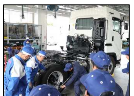
大型車両整備実習