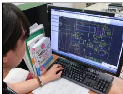
2次元CAD実習 (使用ソフト: AutoCAD)