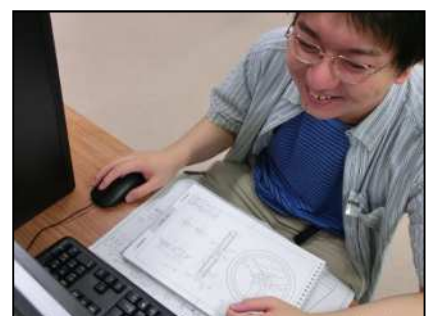
3次元CAD実習 (使用ソフト: Inventor)