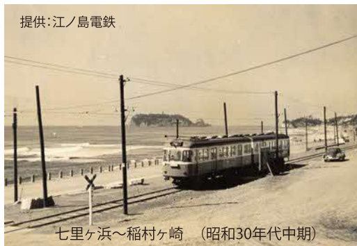
七里ヶ浜～稲村ヶ崎 (昭和30年代中期)