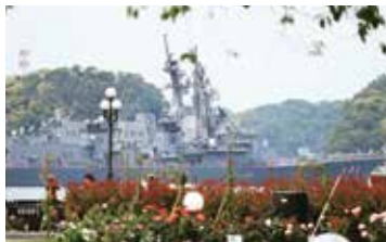
横須賀ヴェルニー公園 →