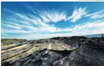
← 城ヶ島 海岸