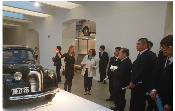
第48回 シュコダ・オート株式会社(チェコ) チェコ最大の自動車メーカー、「ミュージアムを見学」