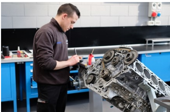
第47回 ティー・エム・パフォーマンス社(イタリア) 自動車部品メーカー、「パートナー企業が使用したエンジンの解析」