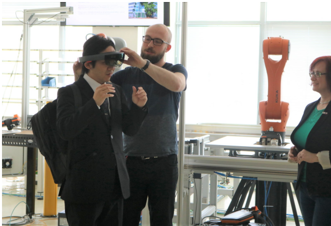
第48回 チェコ工科大学 CIIRC、大学所属研究機関 「VR機械の体験」(各設備の情報が表示される)