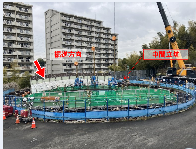
中間立坑(トンネル到達部)