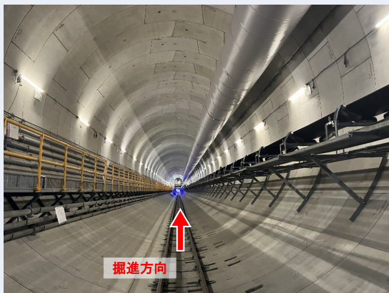
トンネル坑内(発進立坑から650m地点)