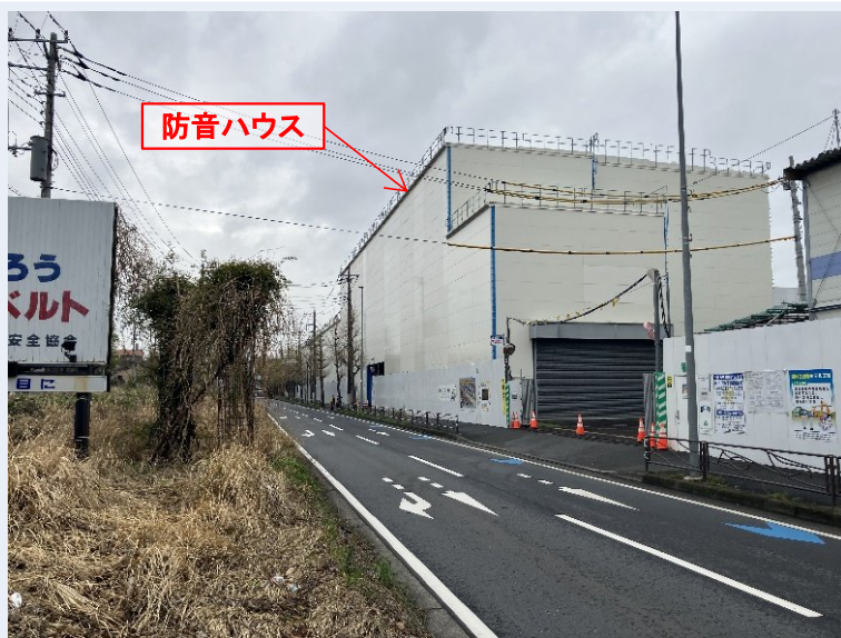
工事ヤード(防音ハウス)全景