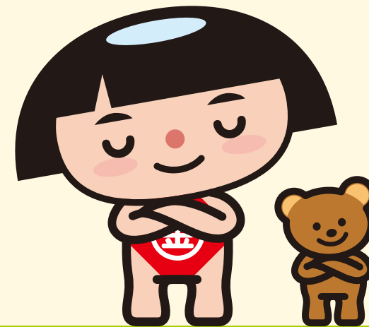
神奈川県PRキャラクター かながわキンタロウ