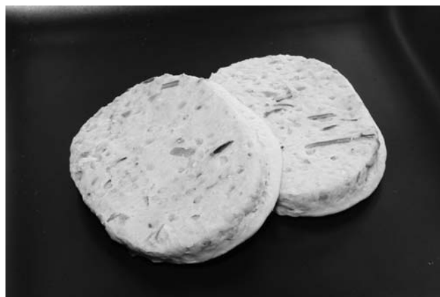
図1 給食物資「鰯ハンバーグ」

平成16年11月に鰯ハンバーグ（図1）については、図2の新規物資資料に記載のとおり、小田原市の給食物資として登録された。また、マアジ及びカマス（主にヤマトカマス Sphyræna japonica ）を用いた減塩干物と醤油と砂糖のみで製造した醤油干しも、同様に登録が行われた。合わせて、既に小田原おでん会により製品化された「たこ天」もサイズをひと回り小さくし、学校給食物資に登録された 9) 。