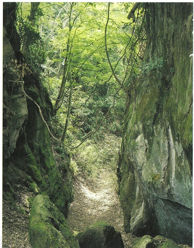
大仏切通（大仏・長谷観音歴史的風土特別保存地区）