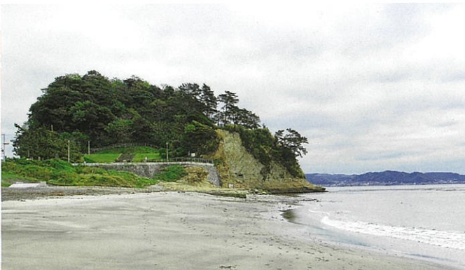
稲村ヶ崎（稲村ヶ崎歴史的風土特別保存地区）