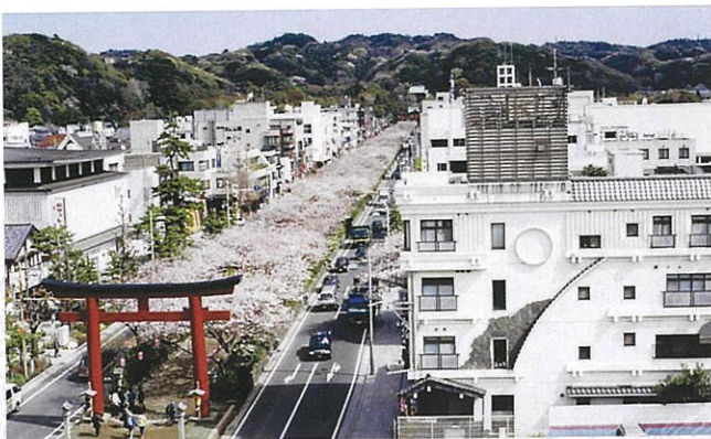
段葛（八幡宮歴史的風土保存区域）

なお、届出書の書式は、鎌倉市都市計画課・逗子市緑政課の窓口、または神奈川県ホームページから入手できます。