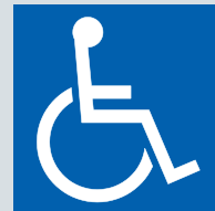
車椅子使用者用 駐車区画