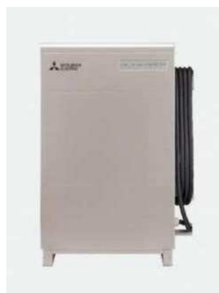
SMART V2H (三菱電機)