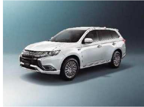
アウトランダーPHEV(三菱)