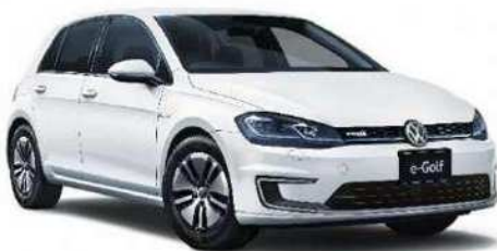
e-Golf(フォルクスワーゲン)