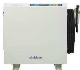
EV パワー・ステーション(ニチコン)