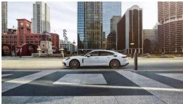
パナメーラ ターボ SE ハイブリッド(ポルシェ)