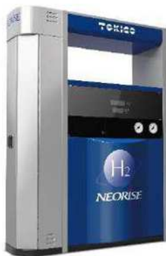
NEORISE (トキコシステムソリューションズ)