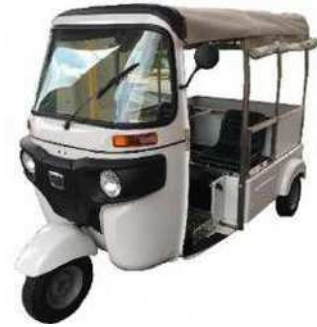
エレクトライク(日本エレクトライク)