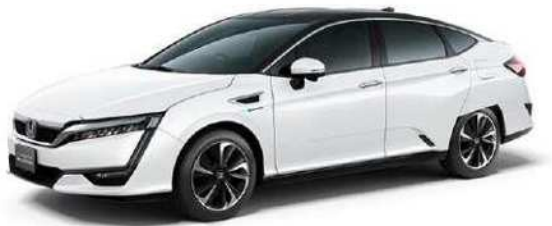
クラリティ FUEL CELL(ホンダ)