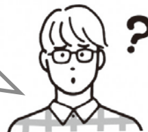
労働組合員・労働組合役員など

かながわ労働センターでは、職員が出向いて、労働問題に関するご希望の内容について説明しています（出前労働講座）。日程や内容についてはご要望に応じて調整しますので、まずはご相談ください。