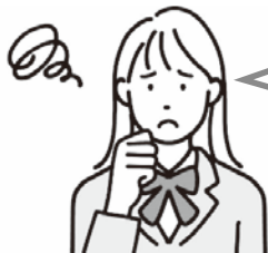
高校生・専門学校生 大学生など