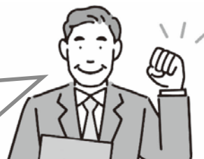
事業主・会社の管理職など