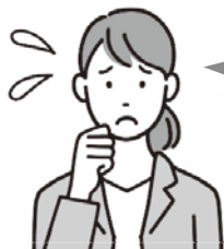
会社の人事労務担当者