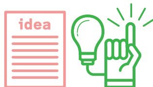
[特許権や実用新案権等の知的財産権]