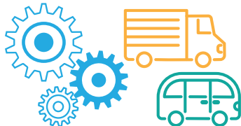
[機械装置や自動車]