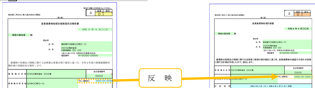
様式 3 : 別紙処理フロー（3-2）