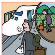
遠くにひとりで住む高齢の親が心配で頻りに通っている