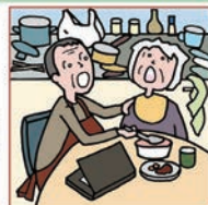
仕事を辞めてひとりで親の介護をしている