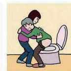
障がいや病気のある家族の入浴やトイレの介助をしている

©一般社団法人日本ケアラー連盟 / Illustration: Izumi Shiga