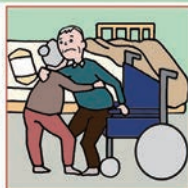
健康不安を抱えながら高齢者が高齢者をケアしている