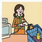
家計を支えるために労働をして、障がいや病気のある家族を助けている