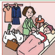
仕事と介護でせいっぱいでほかに何もできない