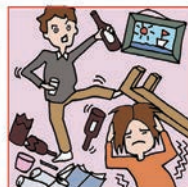
アルコール・薬物依存やひきこもりなどの家族をケアしている