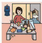
アルコール・薬物・ギャンブル問題を抱える家族に対応している