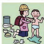
家族に代わり、幼いきょうだいの世話をしている