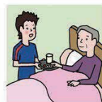
がん・糖尿病・精神疾患など慢性的な病気の家族の看病をしている