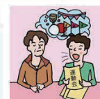
日本語が第一言語でない家族や障がいのある家族のために通訳をしている