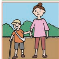
障害をもつ子どもを育てている

ケアラーとは、こころやからだに不調のある人の「介護」「看病」「療育」「世話」「気づかい」など、ケアの必要な家族や近親者、友人、知人などを無償でケアする人のことです。