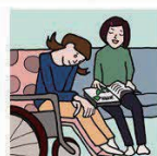
障がいや病気のあるきょうだいの世話や見守りをしている