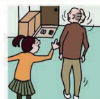
目を離せない家族の見守りや声かけなどの気づかいをしている