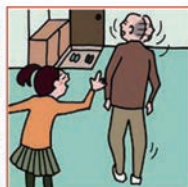
目を離せない家族の見守りなどのケアをしている