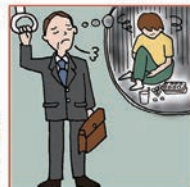
障害や病気の家族の世話や介護をいつも気にかけている

©一般社団法人日本ケアラー連盟 / Illustration: Izumi Shiga