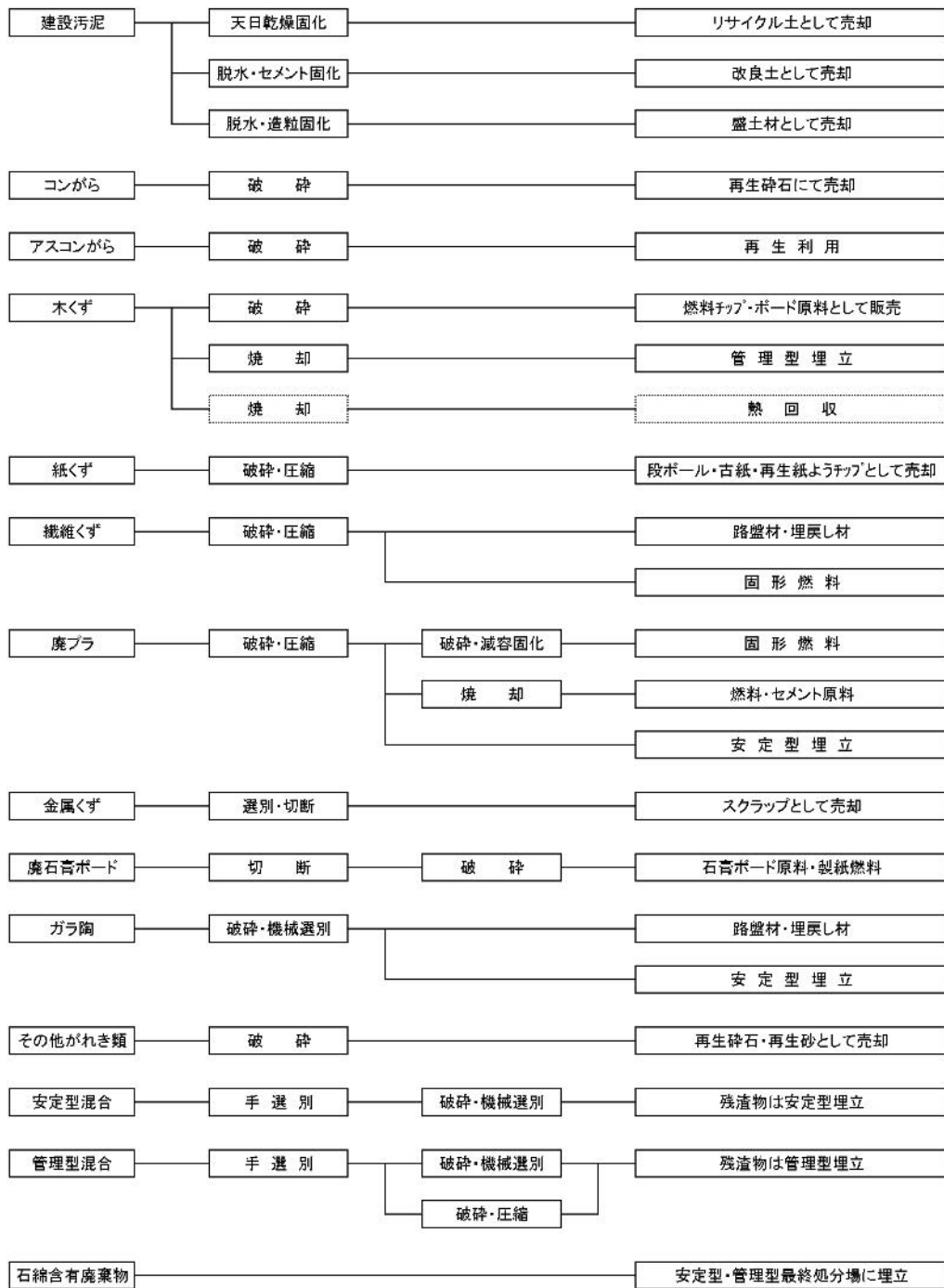
産業廃棄物の一連の処理の工程