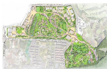
2027年国際園芸博覧会 会場平面図

「幸せを創る明日の風景」をテーマに横浜市で開催される2027年国際園芸博覧会を通じて、国際的な園芸・造園の振興や社会的な課題解決等に貢献する取組を横浜市などと連携しながら進めます。