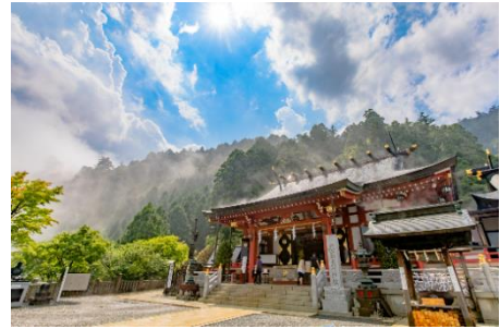
大山阿夫利神社下社

大山地域など多彩な地域資源を生かした観光の振興、国、町と連携した明治記念大磯邸園の整備、湘南港を基点とした海洋ツーリズムの推進や海上交通の充実により、地域の活性化を促進します。