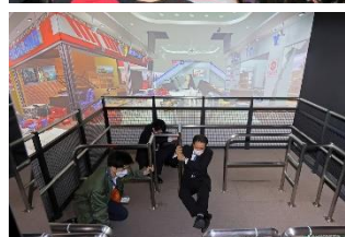
総合防災センター (地震体験)