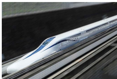
リニア中央新幹線

リニア中央新幹線の建設促進やJR相模線複線化等の促進 など鉄道網の整備を促進します。また、厚木秦野道路(国 道246号バイパス)の整備促進を図るとともに、県道42 号(藤沢座間厚木)などの道路網の整備を進めます。