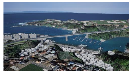
都市計画道路西海岸線 イメージ図

三浦半島地域は、地形などの制約から幹線道路が少なく、慢性的な交通渋滞が発生していることから、都市計画道路西海岸線などの幹線道路網の整備を進めます。