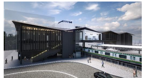
JR 東海道本線 村岡新駅 (仮称)

JR東海道本線の村岡新駅(仮称)の設置や東海道新幹線新駅の設置を促進し、利便性の高い鉄道網の整備に取り組みます。また、新東名高速道路及び厚木秦野道路(国道246号バイパス)などの整備促進を図るとともに、県道410号(湘南台大神)((仮称)ツインシティ橋)などの道路網の整備を進めます。