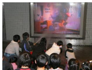
総合防災センター (消火体験)

総合防災センターの臨場感ある体験施設や防災シアター の活用による県民の防災意識の向上を図ります。また、 「かながわ版ディザスターシティ(消防学校の災害救助訓 練施設)」の活用などを通じて、防災関係機関の災害救助 対応力の強化を図ります。