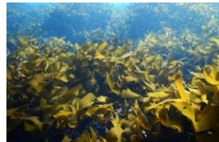
健全な藻場のイメージ図

脱炭素社会の実現に向けて、市町や企業など様々なステークホルダーと連携し、モビリティの電動化やブルーカーボンの取組等を推進します。また、脱炭素化と同時に、関係人口の増加や交通渋滞の解消等、地域特有の課題解決を図ることをめざします。