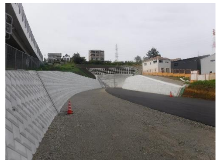
都市計画道路城山多古線

新東名高速道路の整備促進を図るとともに、伊豆湘南道路などの計画の具体化や、都市計画道路城山多古線などの道路網の整備を進めます。また、スマートインターチェンジの整備促進など道路網の有効活用にも取り組みます。