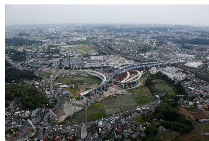
高速横浜環状南線 栄インターチェンジ・ジャンクション

圏央道の一部である高速横浜環状南線や横浜湘南道路の整備を促進し、川崎・横浜地域圏と湘南地域圏及び県央地域圏の結びつきを強化するなど、自動車専用道路網の整備を促進します。