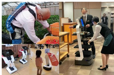
生活支援ロボット

さがみ縦貫道路の沿線地域等を対象に生活支援ロボットの の実用化を図る地域活性化総合特区「さがみロボット産業 特区」(第3期計画)を推進し、県内企業のロボット産業へ の参入とロボットの社会実装を促進します。