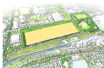
柏尾川新規遊水地

近年、激甚化・頻発化する台風等による豪雨災害の未然防止を図るため、帷子川や今井川などの護岸整備や、柏尾川新規遊水地、矢上川地下調節池の整備など、都市化の進展が著しい地域を流れる河川の整備を重点的に進めます。