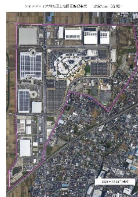
ツインシティ大神地区 土地区画整理事業

再生可能エネルギーの導入など、環境共生モデル都市ツインシティを整備することで、魅力あるまちづくりを推進するとともに、全国や首都圏との交流連携の窓口となる東海道新幹線の新駅を設置し、地域全体の活性化を図ります。