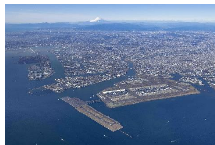
京浜臨海部

我が国の国際競争力の強化及び県内経済の活性化につなげるため、京浜臨海部ライフィノベーション国際戦略総合特区を拠点として産業及び技術の集積を推進することで県内における基幹産業の創出・育成を促進します。