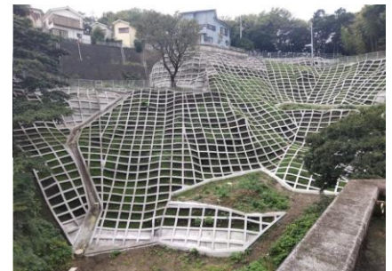
急傾斜地崩壊防止施設 大滝町地区（横須賀市）

自然災害から県民の生命や財産を守るため、大沢地区や佐原1丁目C地区などにおいて、地域の地形や自然状況などに応じた土砂災害を防止する施設などの整備を進めます。