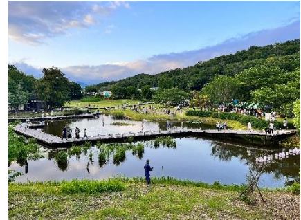
中井町 巖島湿生公園

「つながり」と未病改善のライフスタイルを実践する「かながわ県西での“心地よい”暮らし」をめざす姿として、未病の戦略的エリアの特色をはじめとした地域の魅力を生かし、移住・定住の促進や周遊促進などを行う「県西地域活性化プロジェクト」を推進します。