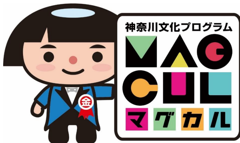
神奈川県 PR キャラクター かながわキンタロウ