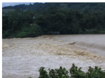
洪水時の状況（相模川）