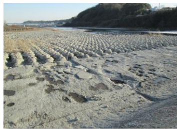
洪水による劣化状況（固定堰）