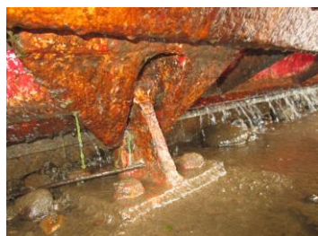
転倒ゲートの劣化状況