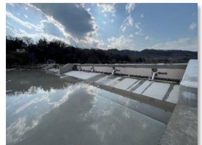
転倒ゲートの完成状況