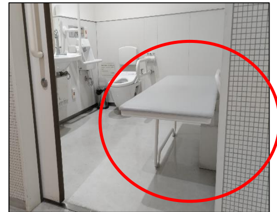
（ユニバーサルシート）