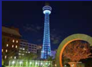
横浜マリンタワー