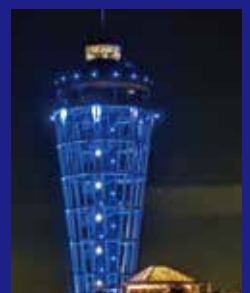
江の島シーキャンドル