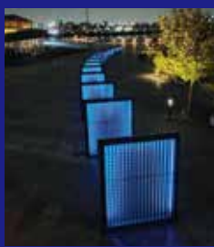
象の鼻パーク (スクリーンパネル)