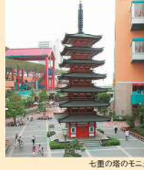
七重の塔のモニュメント