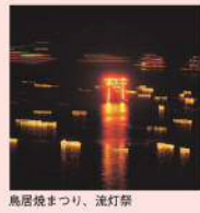
鳥居焼まつり、流灯祭