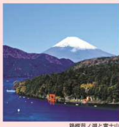
箱根芦ノ湖と富士山

芦ノ湖は約300年前に箱根火山のカルデラの中にできた周囲19kmの細長い湖です。南岸の杉並木街道から眺める「逆さ富士」は、箱根の絶景の一つです。ニジマス、ブラックバス、わかさぎ等が生息しており、多くの人が釣りを楽しんでいます。 ●JR東海道線・小田急小田原線「小田原駅」から元箱根、箱根町行き又は湖尻、桃源台行きバス終点下車 箱根町総合観光案内所 ☎0460-85-5700