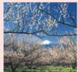
曾我梅林と富士山