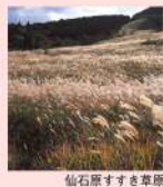
仙石原すすき草原

大昔、仙石原は湖底にあったことから、現在その名残をとどめノナシヨウブ、ミズゴケなど珍しい温帯植物が多く国の天然記念物に指定されています。秋になると草原が黄金色のススキで輝きます。 ●JR東海道線・小田急小田原線「小田原駅」から湖尻、桃源台行きバス約45分「仙石案内所」下車 箱根町総合観光案内所 ☎0460-85-5700