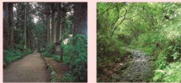
旧街道杉並木 旧街道石畳