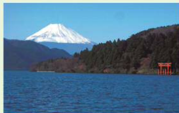
芦ノ湖と富士山 (p21 箱根町)

冬は空気が澄み、美しい富士山がよく見えます。県内の様々なスポットから、遙かな富士・身近な富士を望むことができます。