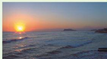
江の島と沈む夕陽