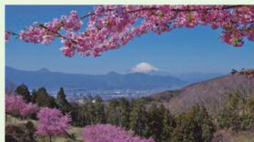
おおいゆめの里の早咲き桜と富士山 (p25 大井町)