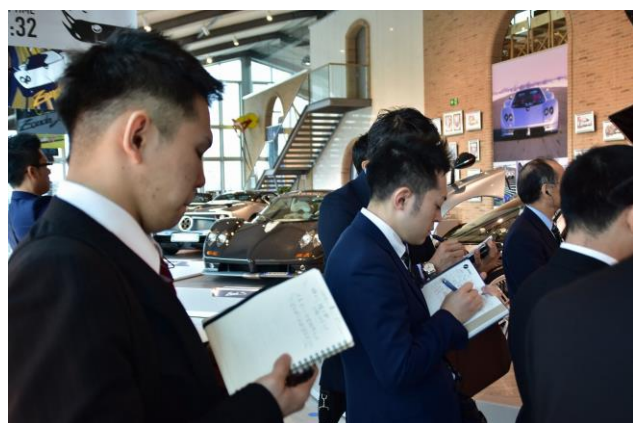
イタリア、「パガーニ社」 自動車製造