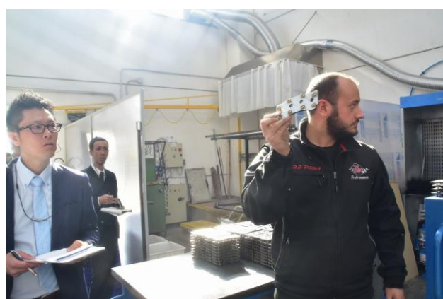
イタリア、「TMパフォーマンス社」 自動車部品製造