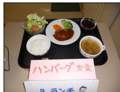
大量調理実習(常食)