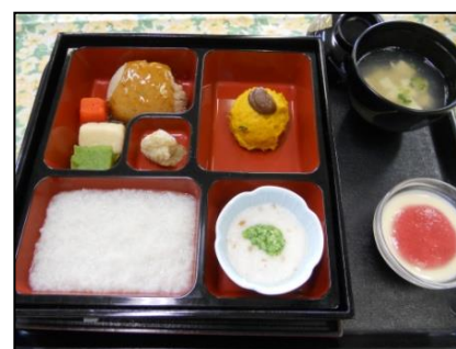
大量調理実習(介護食)