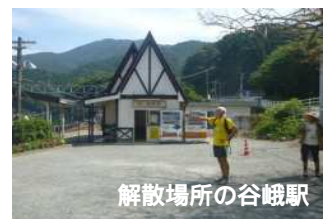
解散場所の谷峨駅