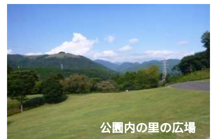
公園内の里の広場

問合せ先：神奈川県県西土木事務所道路都市課 電話番号：0465-83-5111（代表） ファクス：0465-83-7532