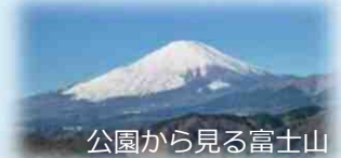
公園から見る富士山

問合せ先： 県西土木事務所道路都市課 (公園関係) 0465-83-5111(代表) 山北町教育委員会生涯学習課 (史跡関係) 0465-75-3649