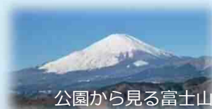
公園から見る富士山

問合せ先： 県西土木事務所道路都市課 (公園関係) 0465-83-5111(代表) 山北町教育委員会生涯学習課 (史跡関係) 0465-75-3649