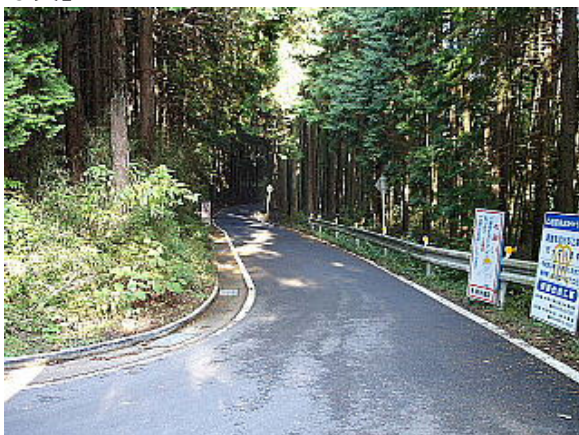
改良前の様子(平成18年7月)