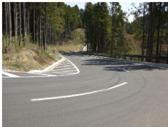
改良後の状況(平成23年4月)