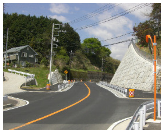
改良後の状況(平成23年3月)