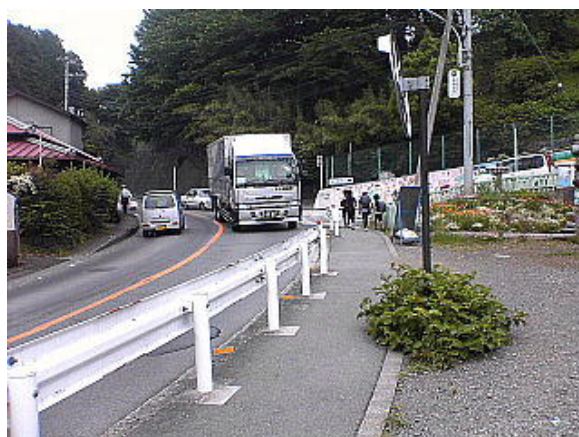
改良前の様子(平成18年4月)